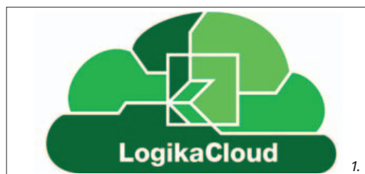
1. Il marchio del sistema LogikaCloud, coordinato alla nuova immagine aziendale